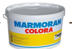
MARMORAN COLORA Peinture pour façade

Peut être appliqué sur tous les fonds solides, propres et secs