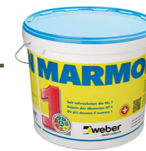
MARMORAN Crépi de finition silicone

Colle et masse d'enrobage pour tous les systèmes d'ITEC MARMORAN