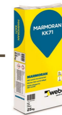
MARMORAN KK71 Mortier ISO-combi allégé

Colle et masse d'enrobage pour tous les systèmes d'ITEC MARMORAN