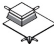
éléments d'angle extérieur/ intérieur pour W40-2

Équerre plastique avec larmier, arête apparente transparente, perforations oblongues et textile soudé par ultrasons. Des connecteurs permettent l'assemblage du profilé. 25 connecteurs fournis.